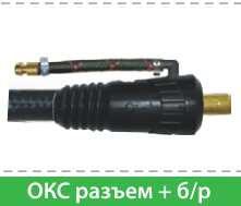
ОКС разъем + 6/p