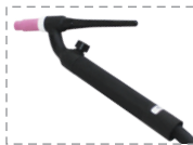
TS 17 FV