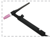
TS 17 V