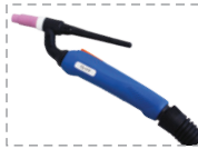
TS 17 F