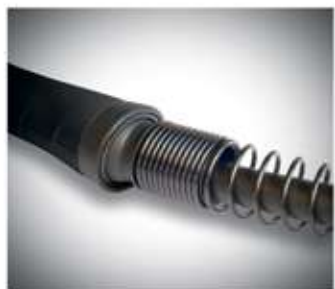
Подпружиненный стабилизатор шлейфа, предотвращает его заломы.