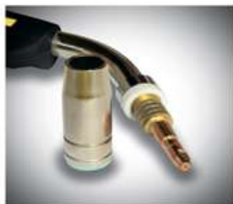
Качественные расходные части.