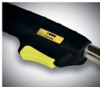
Эргономичная кнопка с плавным ходом.