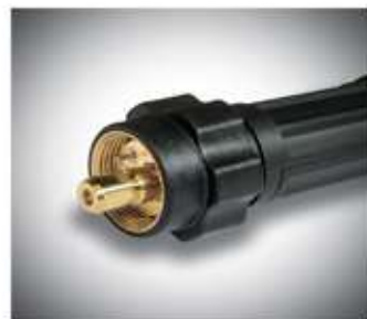
Унифицированный разъем для удобного подключения.